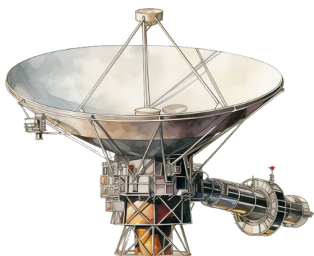
SONDA VOYAGER 2