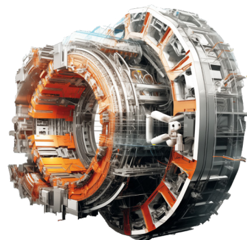
VELKÝ HADRONOVÝ URÝCHLOVAČ